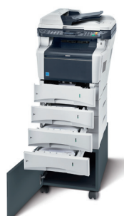
Abbildung mit Optionen.